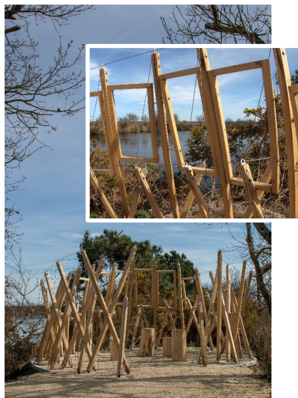
Le Nid paréidolique